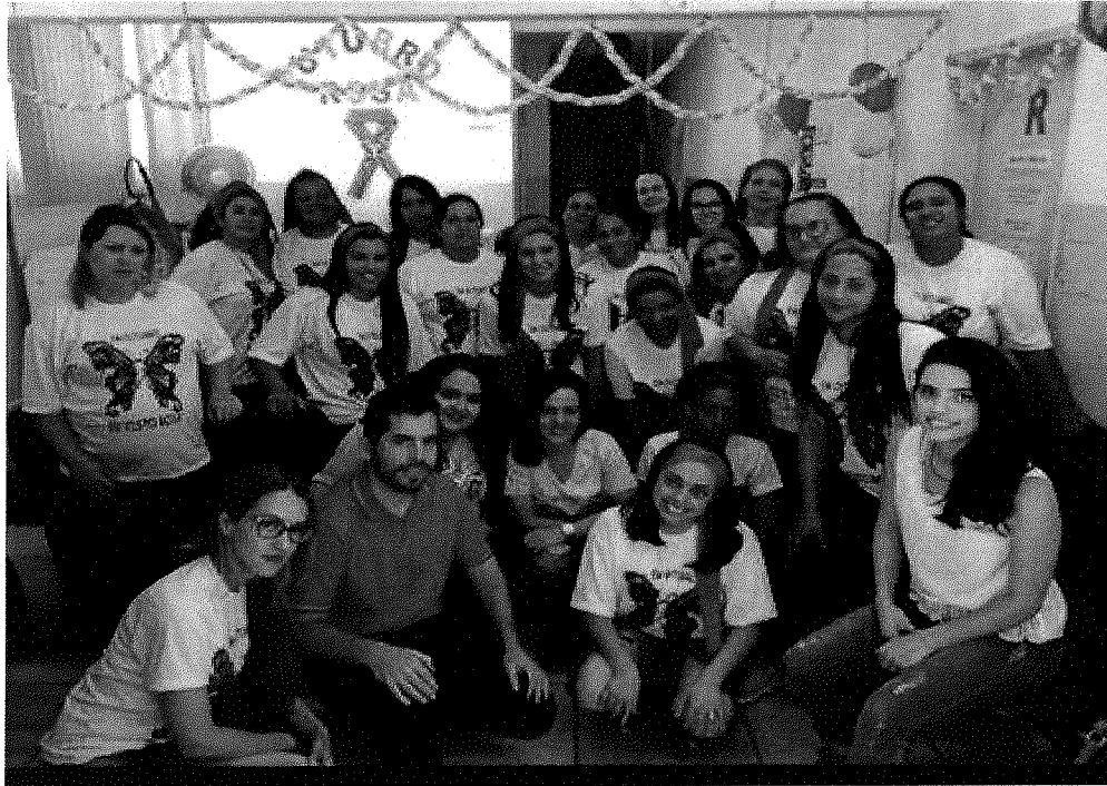
ACÇÕES DE SAÚDE DAS UNIDADES ESPLANADA / NOSSA SENHORA APARECIDA / FÁTIMA OUTUBRO ROSA E MÊS DOS IDOSOS – DIA 26/10/19