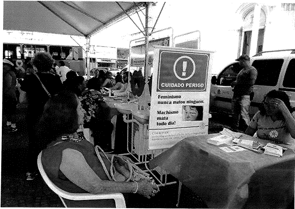
AÇÕES DE SAÚDE DAS UNIDADES SÃO JOÃO – PREVENÇÃO AO CÂNCER DE PRÓSTATA (NOVEMBRO AZUL) – DIA 09/11/19