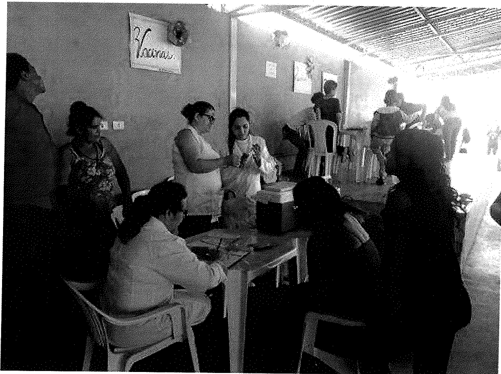
ACÇÕES DE SAÚDE DAS UNIDADES SÃO GERALDO / FOCH / MATERNO INFANTIL – OUTUBRO ROSA E MÊS DAS CRIANÇAS – DIA 05/10/19