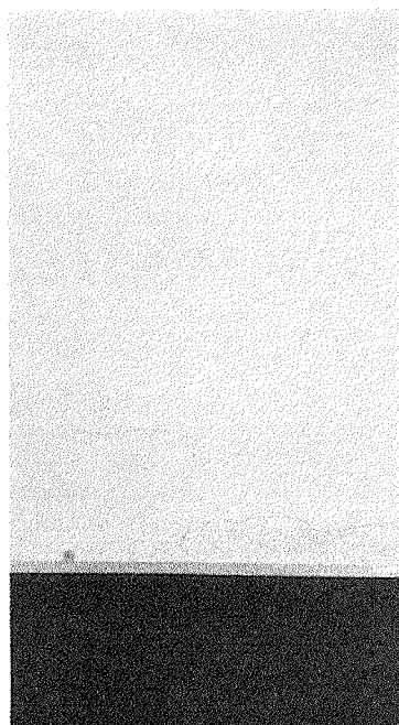
Figura 3 – Trincas na parede da sala de medicamentos.