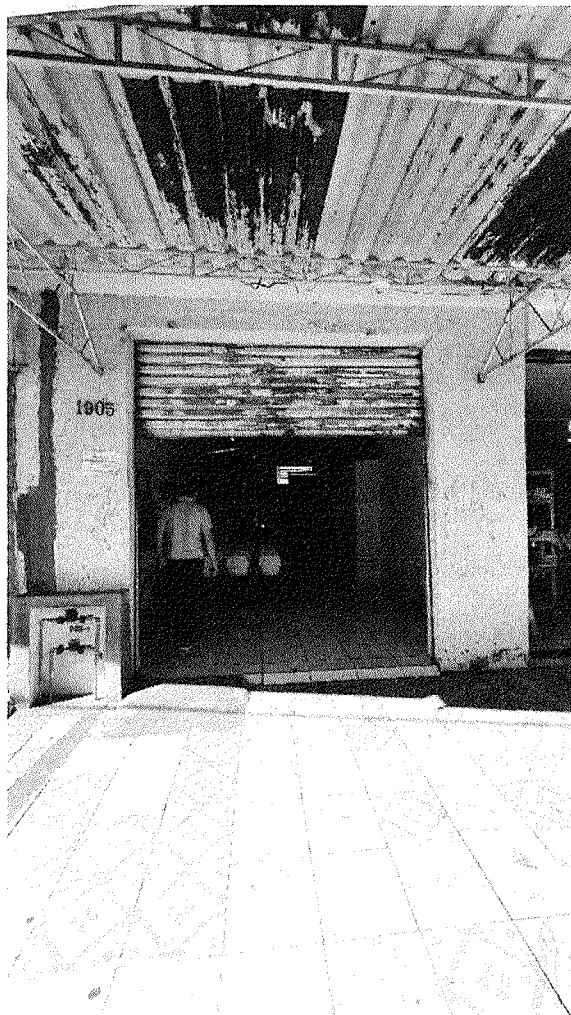
Figura 1 - Fachada da Farmácia Foch