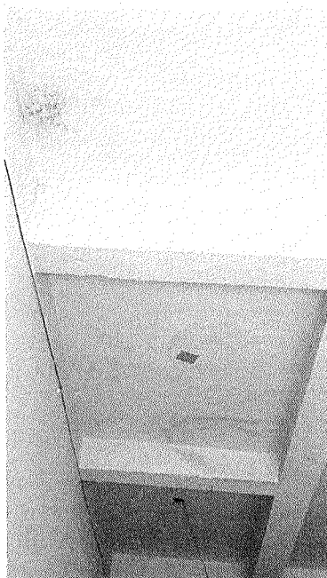
Figura 2 – Infiltração no hall de entrada.