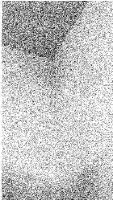
Figura 4 – Infiltração na laje e paredes na sala de atendimento.