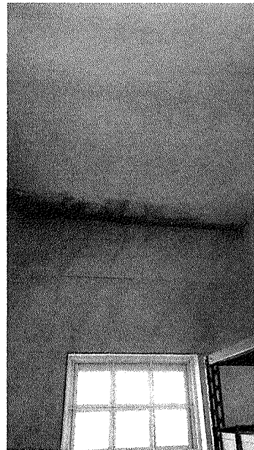
Figura 5 – Infiltração e mofo na laje do banheiro masculino.