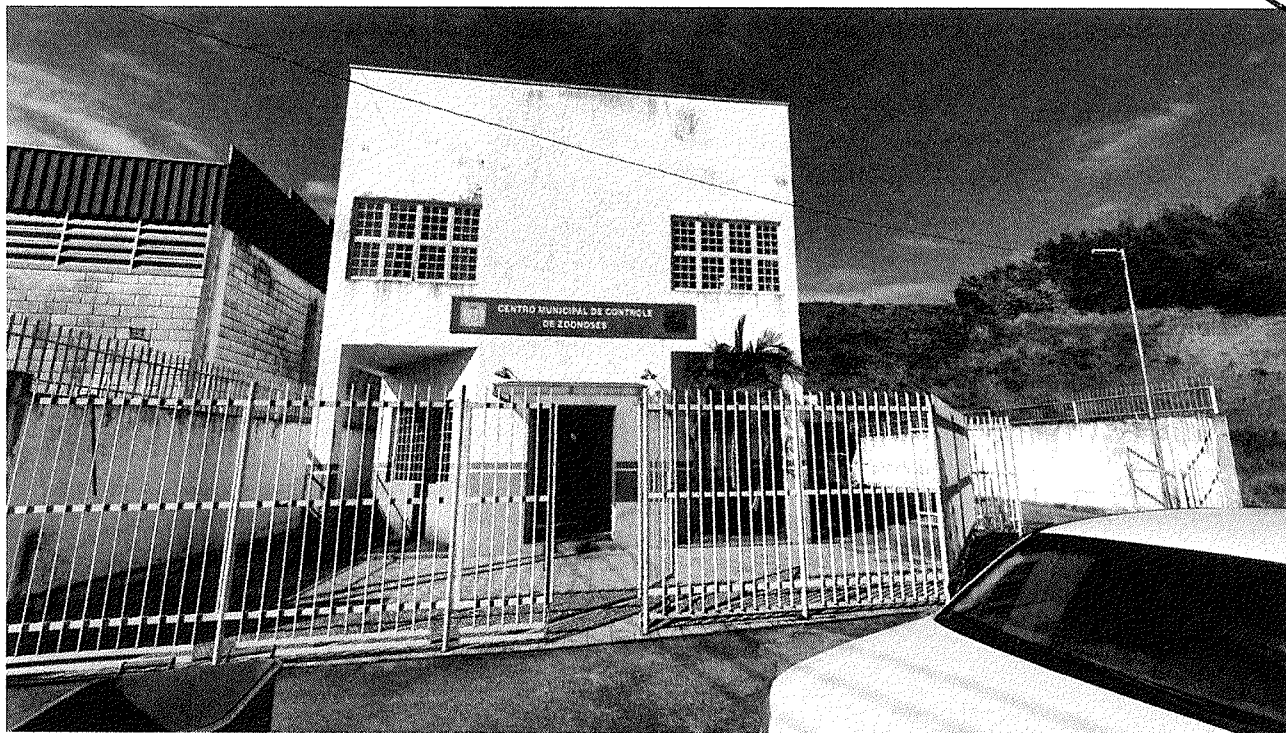
Figura 1 - Fachada do Centro Municipal de Controle de Zoonoses