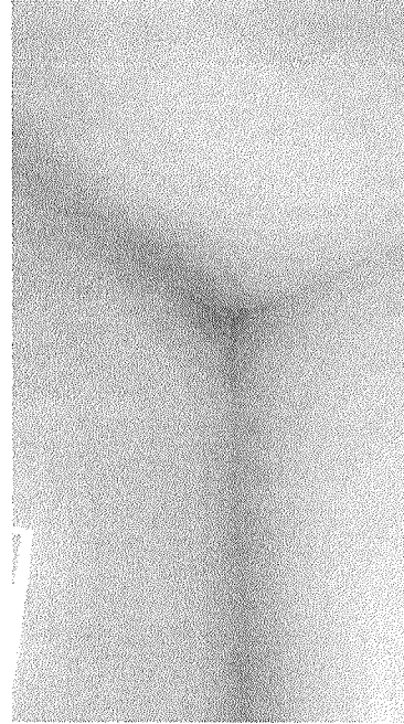
Figura 3 – Infiltração na sala de epidemiologia.