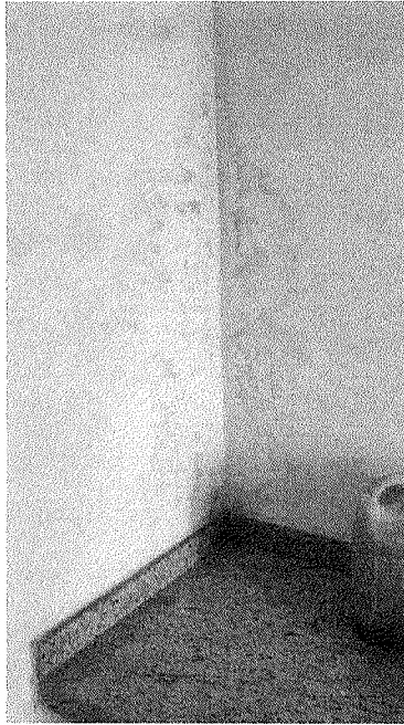
Figura 2 – Umidade na sala de epidemiologia.