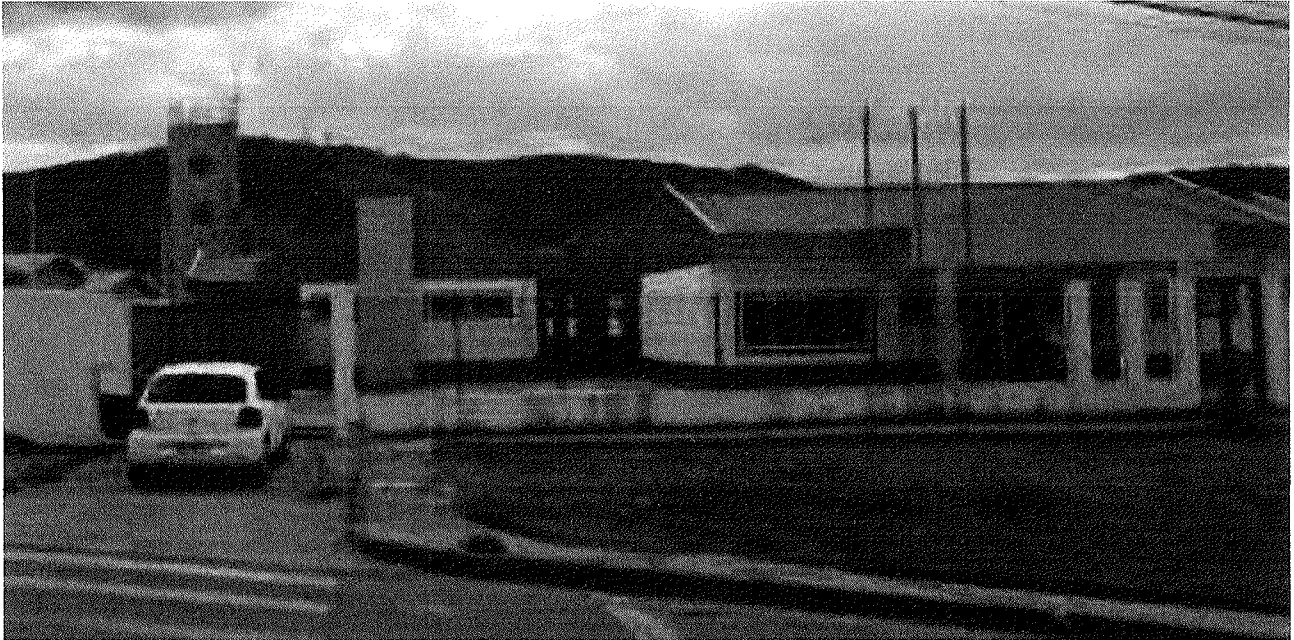
Figura 1 – Fachada: CEIM Jardim Redentor