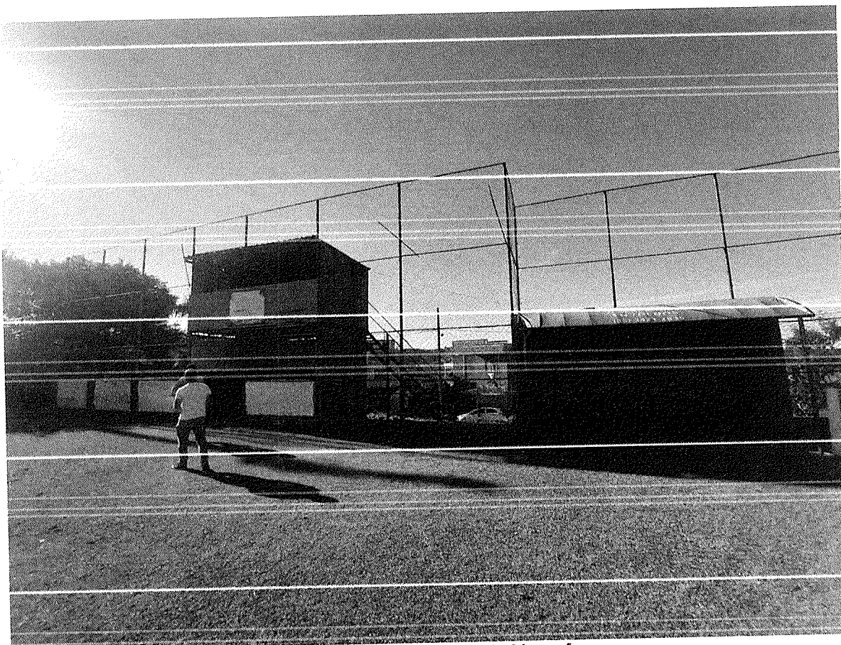
Figura 1 – Fachada do Capitão Massafera.