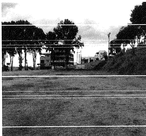
Figura 3 – Falta de manutenção no campo