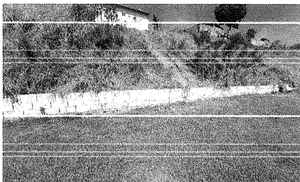
Figura 2 – Muro danificado